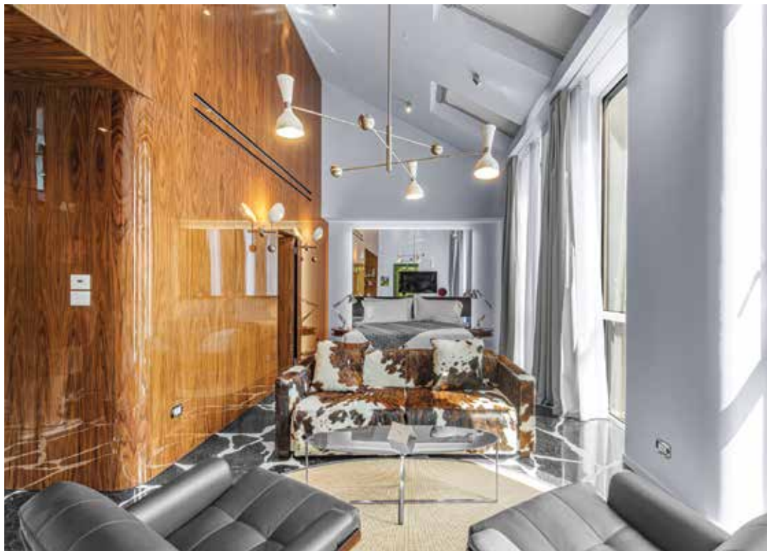
La Penthouse Suite del Calimala Milano, situato in via Melzo 7

“La presenza di nuovi hotel iconici, se non accompagnata da politiche di equilibrio urbano, può trasformare zone storiche in vetrine destinate quasi esclusivamente al turismo alto spendente”