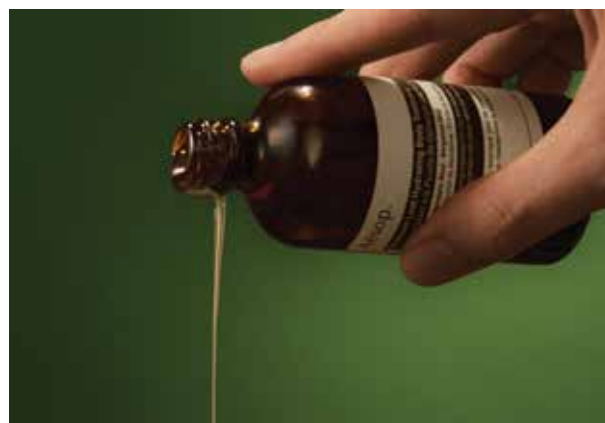
Aesop Geranium Leaf Hydrating Body Treatment: miscela concentrata di oli botanici che nutre in profondità

Trasformare il rientro dalle ferie in un rito di benessere è possibile: micro-rituali, profumi evocativi e prodotti sensoriali come oli e lozioni aiutano a mantenere la calma e a portare la spensieratezza nella routine urbana