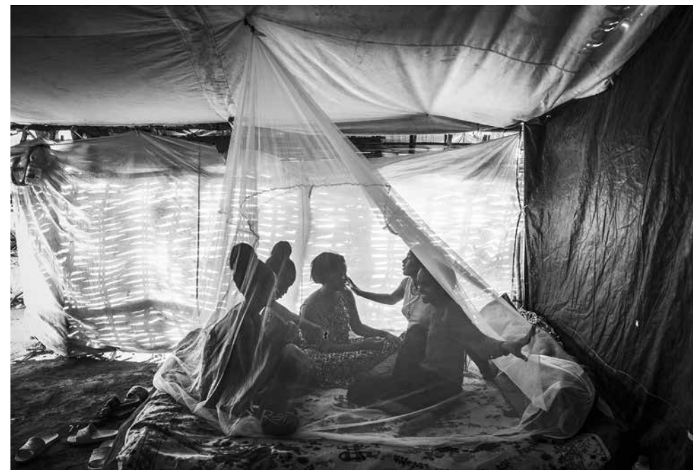
Sotto. World Press Photo Contest 2025. Foto di Cinzia Canneri, nella categoria Long-Term Projects per l'Africa