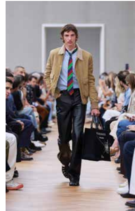
Sopra. Dior primavera estate 2026. Nella pagina accanto. Junya Watanabe Man primavera estate 2026

“Il momento in cui, nei distretti finanziari di tutto il mondo, a termine della giornata lavorativa gli uomini d'affari allentano la cravatta”