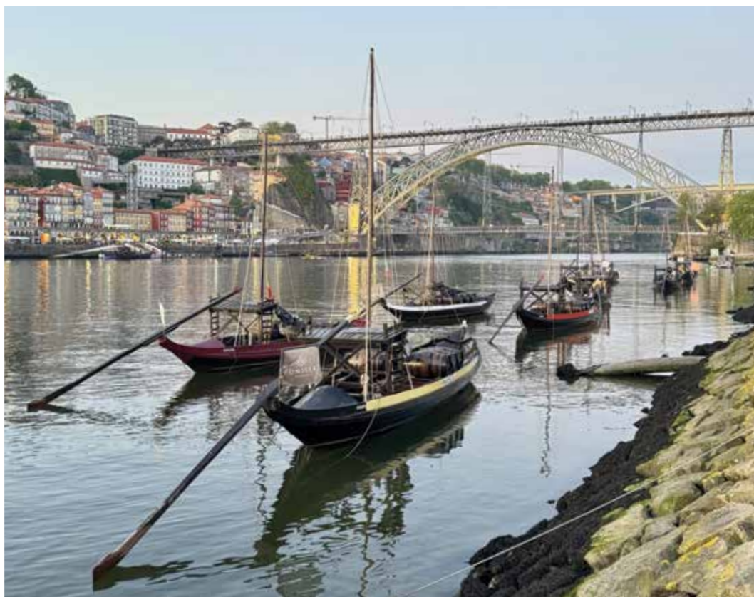
Il ponte Dom Luís I, lungo 385 metri e alto 85, varca il fiume Douro

Porto è l'anima segreta del Portogallo, una città che vive di contrasti e poesia, tra antiche tradizioni e nuova vitalità culturale