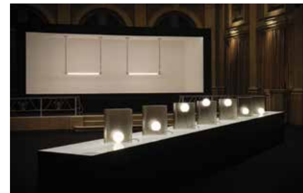
Lampade WonderGlass firmate nendo e Formafantasma per l'installazione Contrasto presentata durante la Design Week 2024 all'Istituto dei Ciechi

“Al buio le persone sono più vulnerabili: la temporanea perdita di un senso chiave porta a rallentare i ritmi e a concentrarsi sull'essenziale”