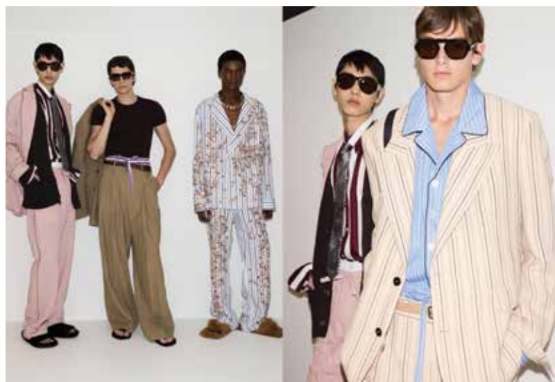
Backstage sfilata Dolce&Gabbana primavera estate 2026