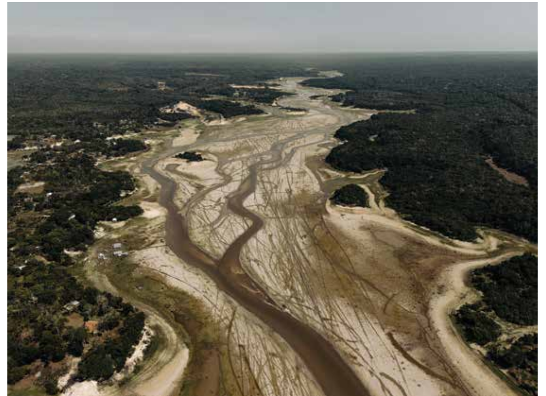
Immagine dalla serie South America Stories .